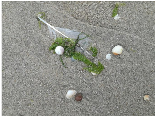
Op het strand zagen we nog mooie zeewier en schelpen en veren.