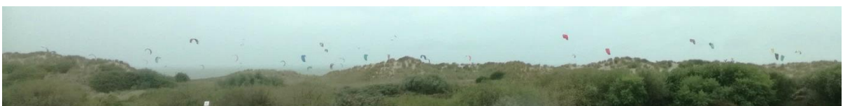
Als we over de Oosterscheldekering rijden zien we kiteservers in de zee met prachtig gekleurde kites.